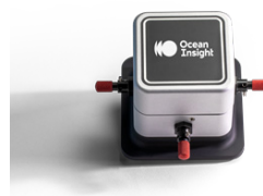
キュベットホルダ