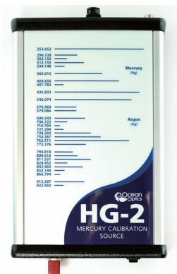
HG-2 波長校正水銀アルゴン光源