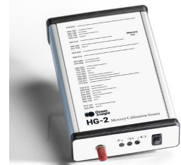
HG-2 波長校正用汞アルゴン光源